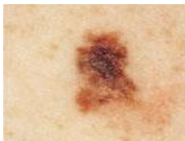
Слика 2 Изглед на меланомот

Меланомот може да се појави на сите делови на телото, како на деловите кои се константно изложени на сонце, така и на деловите кои се заштитени со облека. Кај мажите меланомот се појавува најчесто на трупот, додека кај жените, најчесто се јавува на грбот и на нозете. Подтипот на малигнитетот може да влијае каде туморот ќе се развива; lentigo меланомот е почест на лицето, додека акралниот лентиринозен меланом е почест на дланките, стапалата или на ноктите.