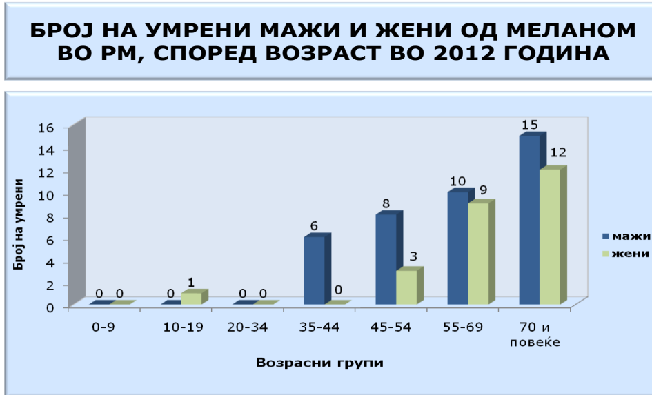
Дијаграм 3. Морталитет по пол и возраст во РМ