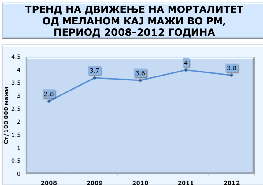
Дијаграм 4. Тренд на движење на морталитет на мажи во РМ