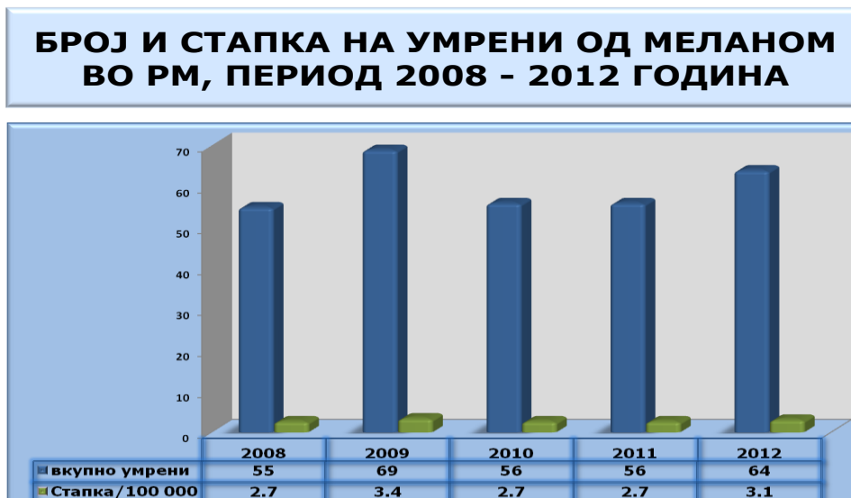
Дијаграм 2. Стапка на морталитет во РМ

Извор: Државен завод за статистика Обработка: Институт за јавно здравје на РМ, Центар за статистичка обработка на податоци, публицистика и едукација