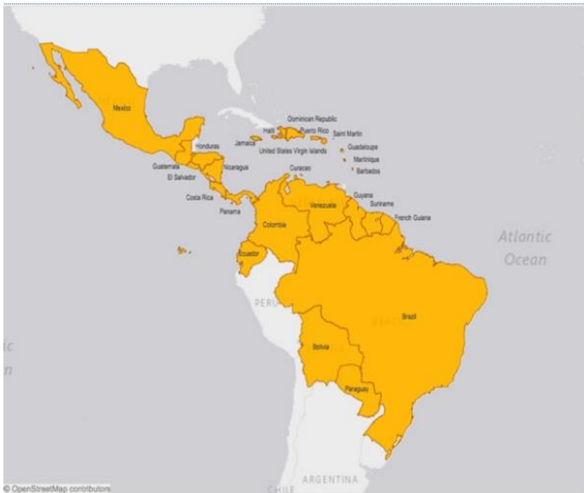
Мапа 3. Земји со регистрирани автохтони случаи на Зика вирусна болест на Америчките континенти (РАНО)