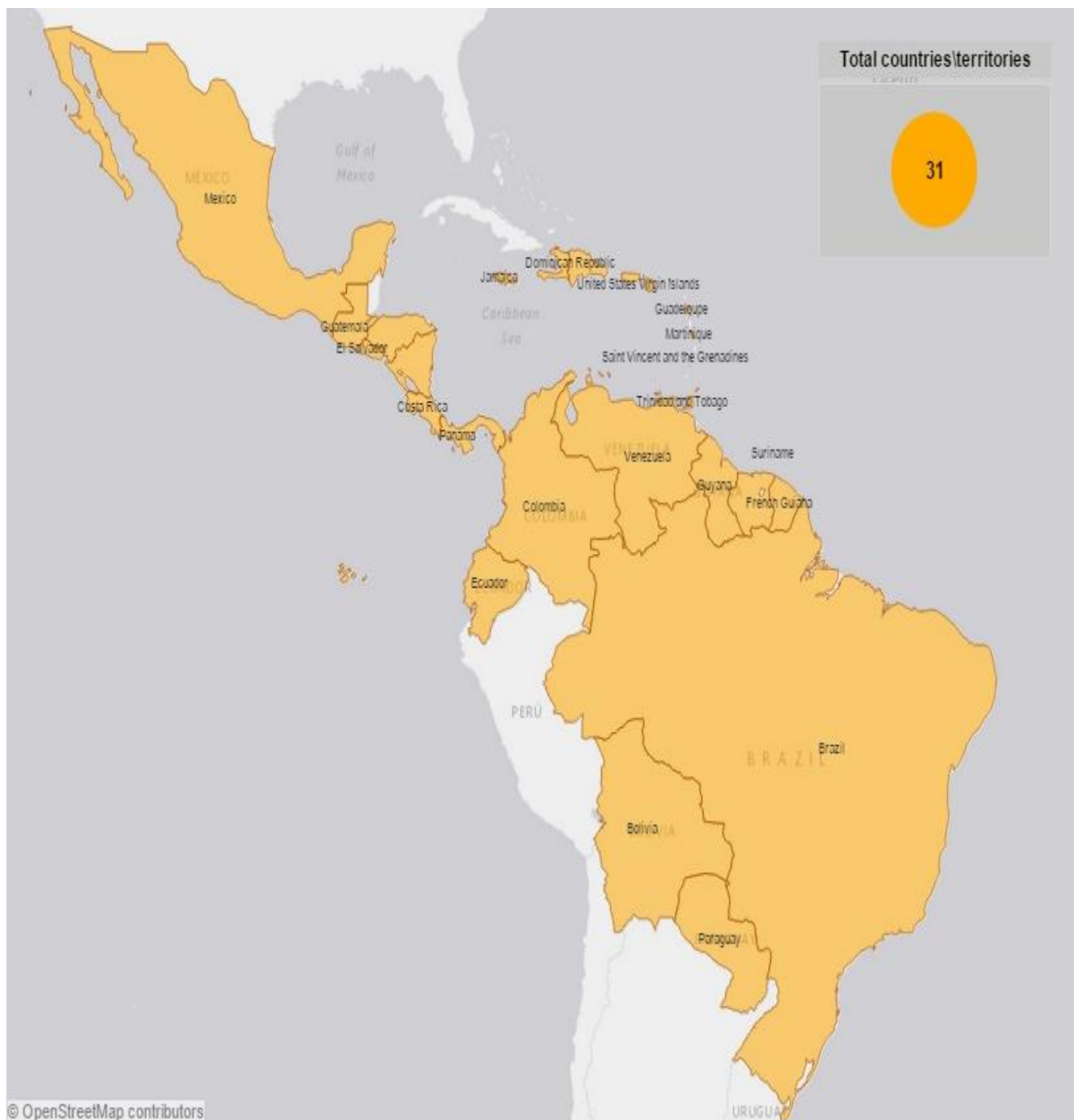
Мапа 3. Земји со регистрирани автохтони случаи на Зика вирусна болест на Америчките континенти (РАНО)