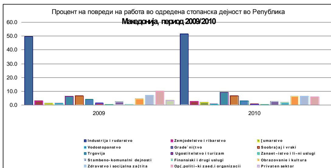
Графикон бр. 1. Компаративен графички приказ на регистрираните повреди на работа според дејност во 2009/2010 година во Република Македонија

Во структурата на вкупниот број на повреди на работа во 2010 година значително повеќе има повредени работници од машки пол во однос на повредени работнички. Така во 2010 година 651 т.е. 74,8% од сите повреди се регистрирани кај работниците, што претставува незначително зголемување на процентуалното учество на повредените работници во структурата на вкупно повредените лица во однос на 2009 година, кога нивната процентуална застапеност изнесува 71,4%. Податоците за половата структура на повредите на работа во 2010 година се прикажани на табела бр. 2 и графикон бр.2.