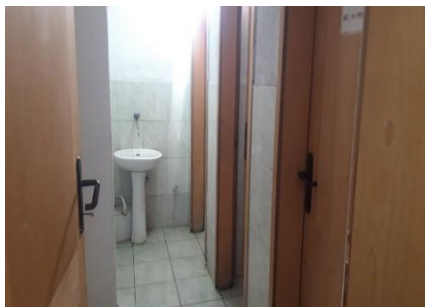
Слика 1. Училишен тоалет, с. Љубодраг ПУ “Карпош”