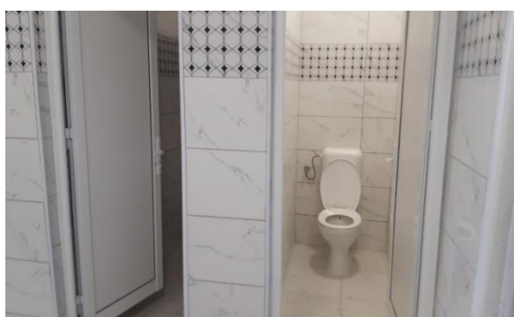
Слика 2. Училишни тоалети, с. Горно Којнаре, училиште “Киро Бурназ”